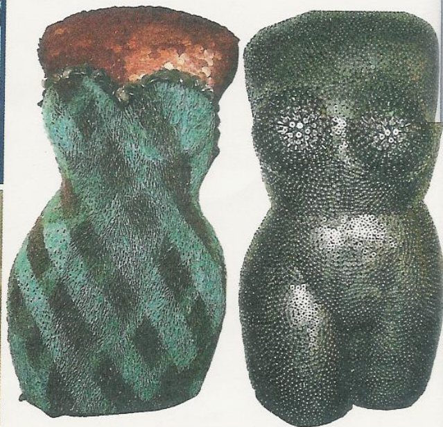
Sopra, due torsi di Federico Uribe: a sinistra, Alta costura , 2002, monetine, cm 29x16x16; a destra, Platiado , 2002, viti, cm 30x17x16. Qui a fianco, Palm tree , un particolare dell'installazione che andrà al Bass museum il prossimo marzo. In alto, Group 23 , busti realizzati nel 2002, con materiali differenti.

riso crea una corrente positiva tra l'artista, l'opera, l'osservatore", dice l'artista.